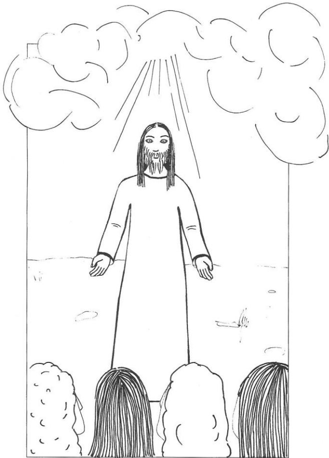
7. neděle velikonoční cyklu A Jan 17,1-11a