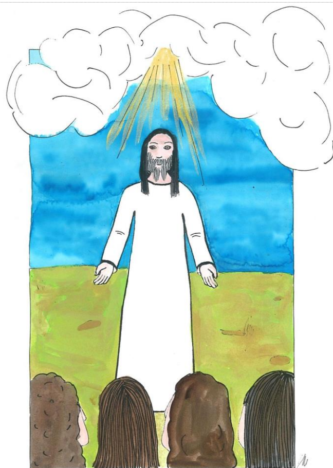
7. neděle velikonoční cyklu A Jan 17,1-11a